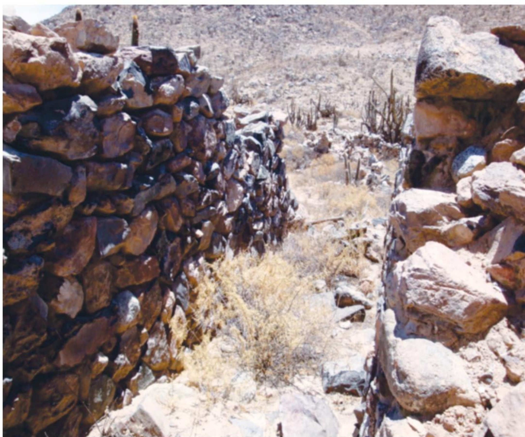
Tambo de Cabracancha.

Los tambos eran capaces de alojar a todos los caminantes. Las coptras eran los almacenes reales de las provincias y pueblos donde tenían su sede los gobernadores principales o sus delegados coptra a secas equivalía a arsenal de armas, cumpi coptra era el depósito de tejidos finos y pirhua coptra eran los graneros (Valcarcel, 1984:85).