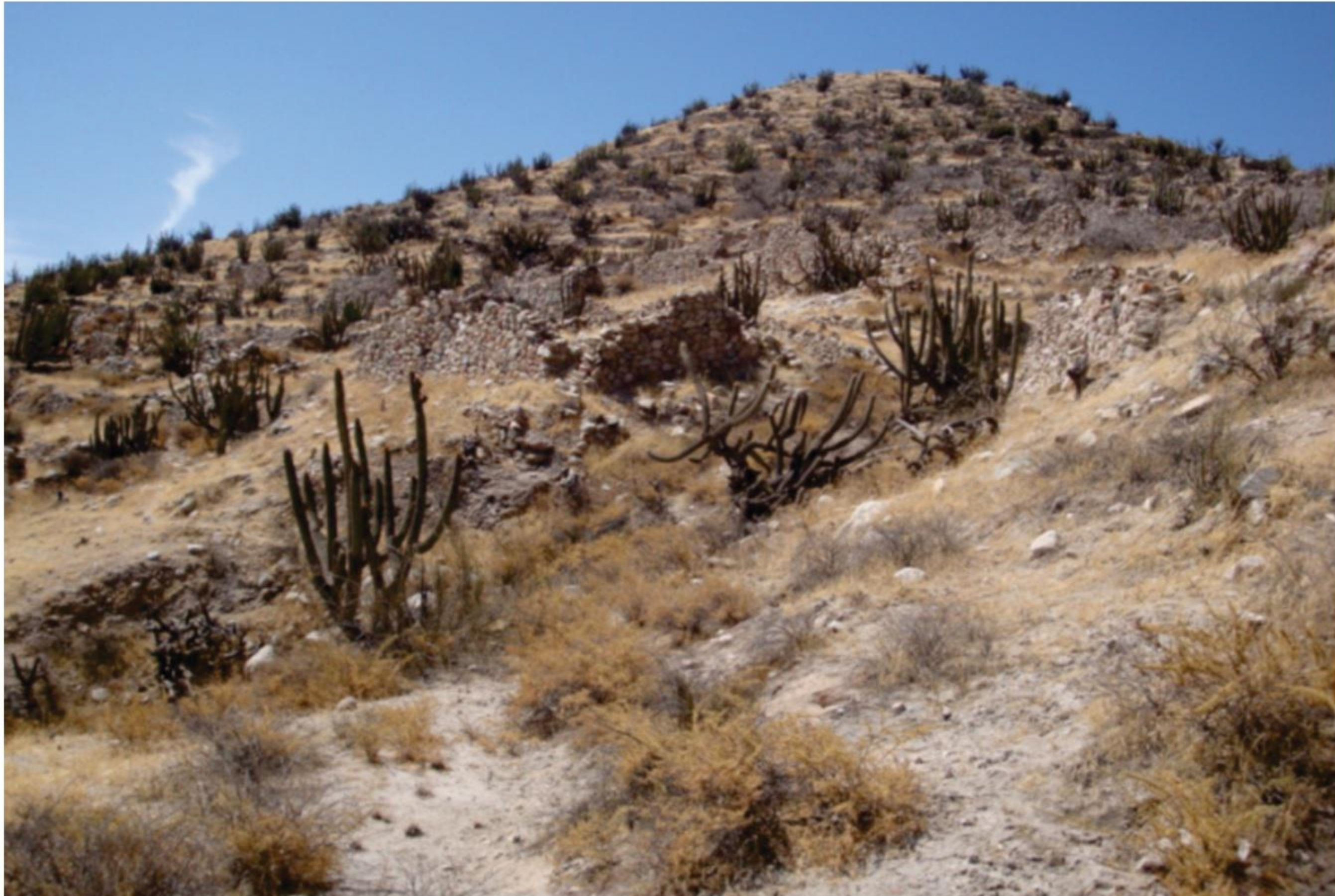
Centro administrativo de los gentiles o Maucallacta de Huacán

valles de forma diversa, lo más notable son los cambios en la infraestructura agrícola ya sea con la construcción de andenes como con la construcción de nuevas acequias sobre las ya existentes (de la Vera Cruz, 1996:149).