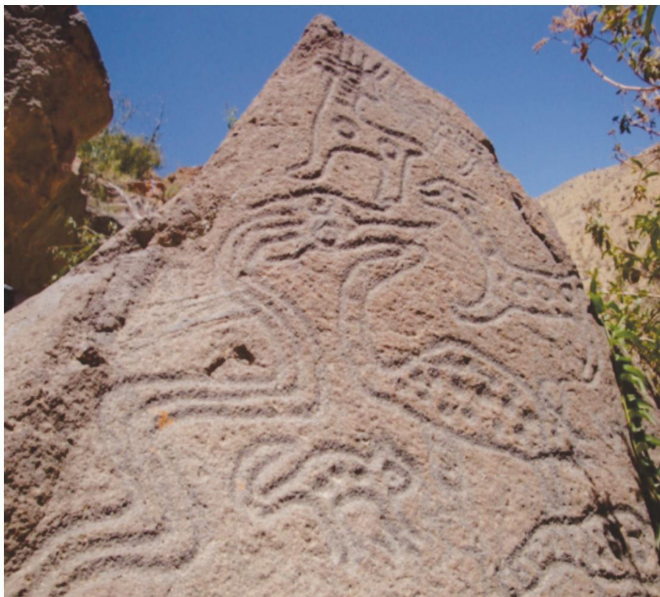
Petroglifo de Cabracancha sobre roca subvolcánica máfica.

Los petroglifos de Cabracancha están vinculados con el tráfico interregional en los diversos pisos bioclimáticos desde el orotropical hasta el termotropical. La complementariedad económica de los diversos pisos ecológicos demuestra que la movilidad de grupos alcanzó aquí un énfasis notable, que permite interpretar el carácter dinámico, cambio y desarrollo de las poblaciones locales. Los petroglifos con motivos de camélidos están muy difundidos en todos estos valles occidentales como el de Sihuas, Majes-Camaná, apareciendo como una red de señales pero geográficamente dispersos.