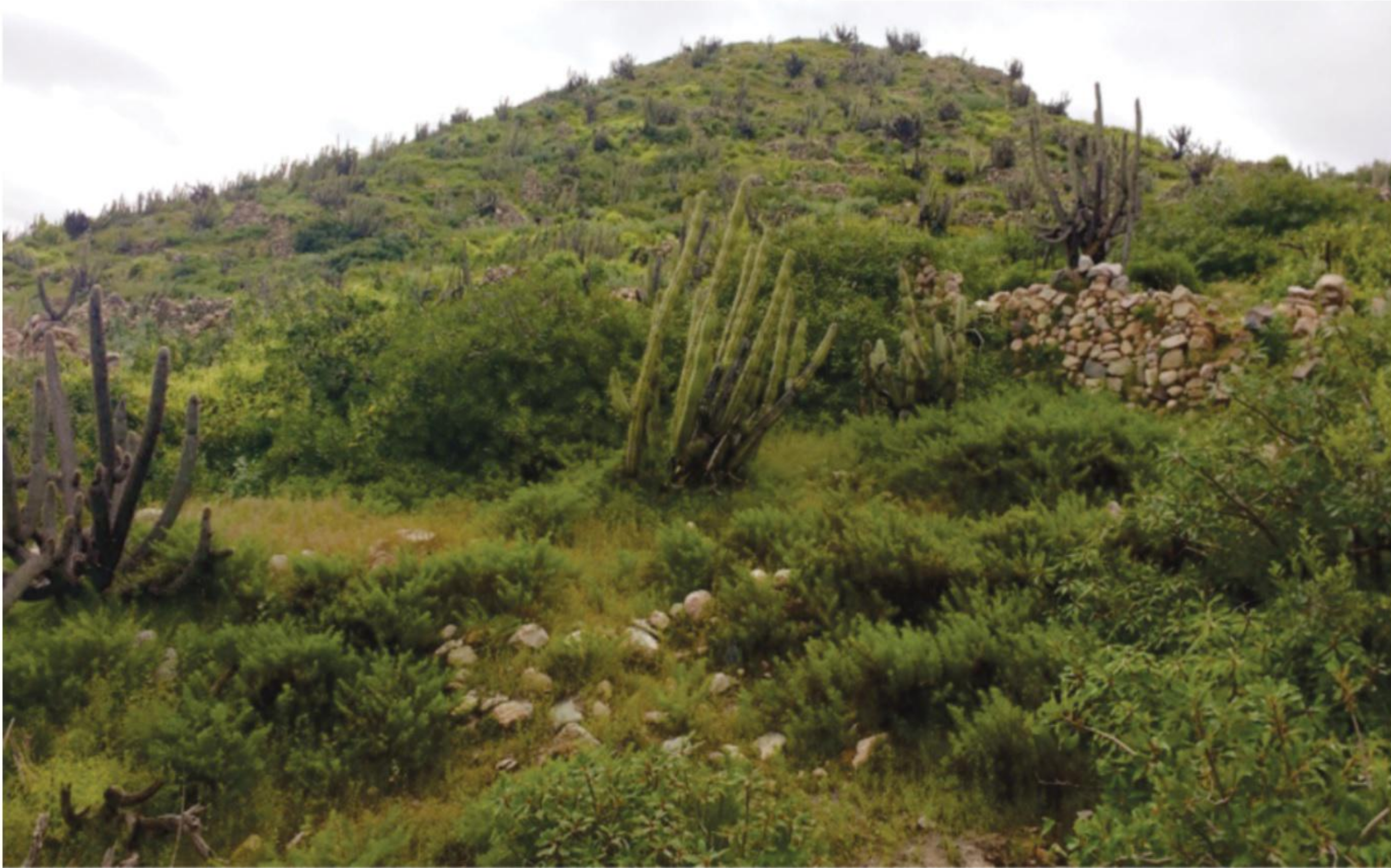
Ambrosia artemisioides, Jatropha macrantha y Corryocactus brevistylus, piso bioclimático termotropical árido.