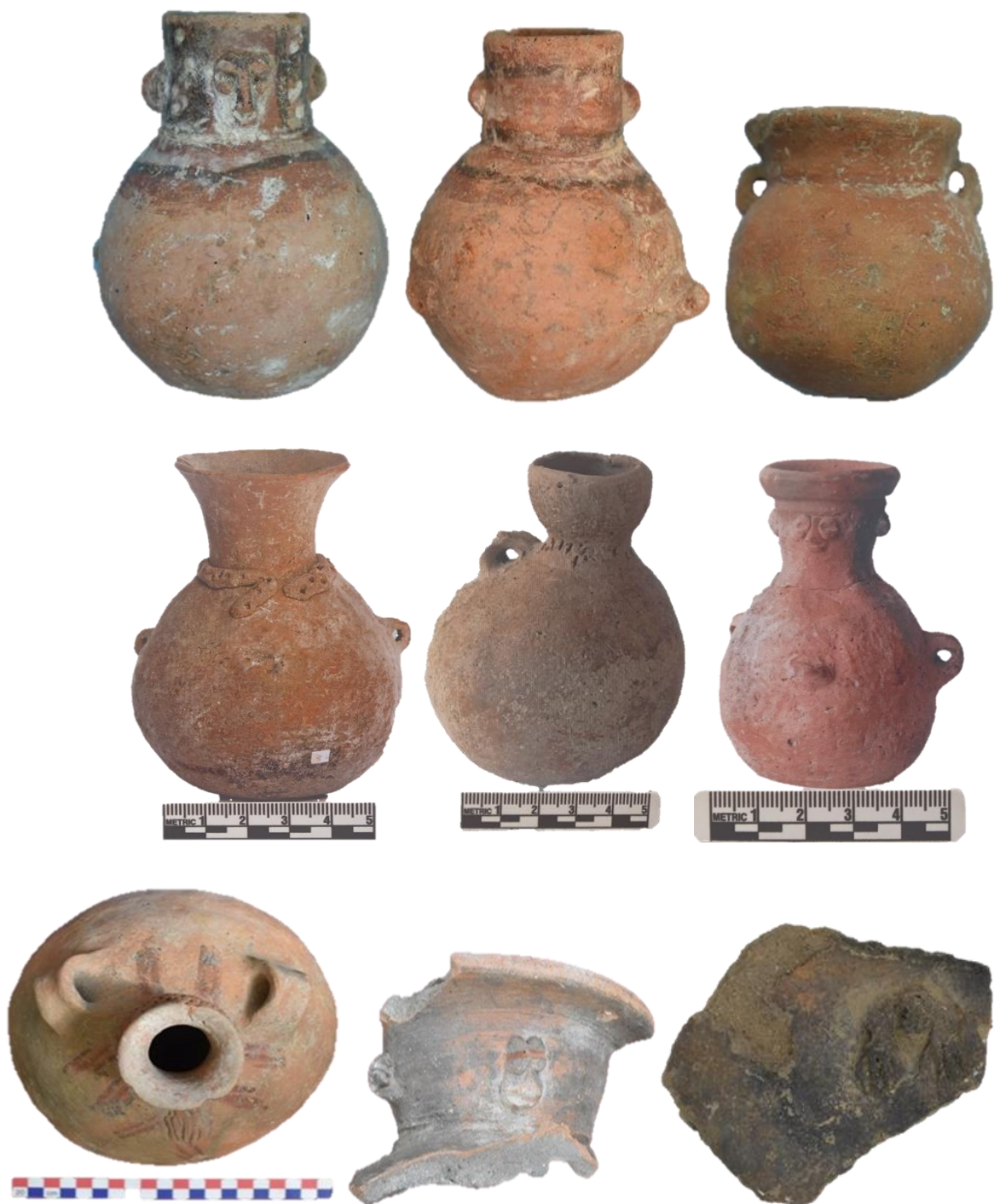
Fig. 10. Cerámica estilo Matapuquio íntegra en miniaturas de procedencia del sitio Wilkaymarka y fuente del museo de sitio Wariwillka.

Formas y decoraciones del estilo Matapuquio-Mantaro Base Clara. (Fig. 11)