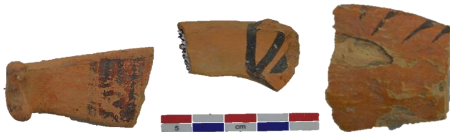
Fig. 04. Tiestos de cerámica, mango de una cuchara y borde de un cuenco de la cerámica estilo caja Huancavelica.

Cerámica estilo Caja. Caja Huancavelica variedad local propia de los territorios actuales de la provincia de Acobamba, Angaraes y Huancavelica (Willkaymarka), confundida con la variedad local de la cerámica Huarpa (cerámica Ayacuchano), fue estudiado por Matos (1958). Sus formas más destacadas son ollas de cuerpo globular, semiglobular y oblongo, con bordes afilados, biselados interiormente y en algunas redondas y casi siempre convergentes; asas cintadas muy pequeñas; bases convexas, planas y golletes angostos o tubulares. Platos con paredes bajas, tazas y cucharas con mango cintada figurativo. Sus características técnicas presentan, en general, pulido y ocasionalmente bruñido; pasta de textura fina y compacta de color anaranjado amarillenta, cuya dureza varía entre 5 a 6 de la escala Mohs, sus decoraciones es pintada simple, en la que destacan líneas ondulados, líneas paralelas, dispuestas principalmente en el borde de las vasijas, especialmente en el bisel interior y exterior. Los colores utilizados son negro y blanco con ligeras variantes en el tono y ocre. (Fig.04)