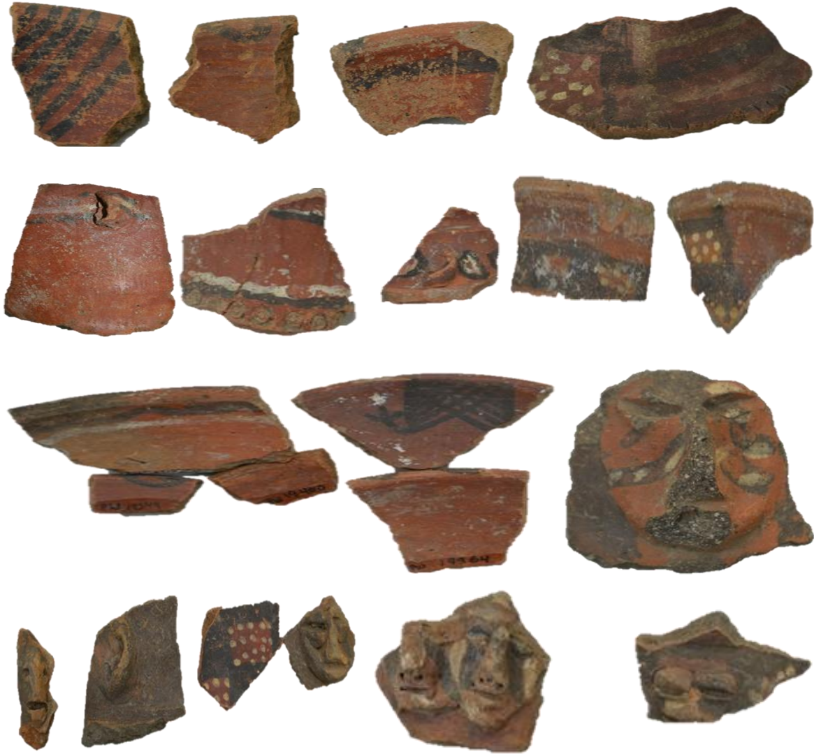
Fig. 13. Fragmentos de cerámica del estilo Arhuaturo de cántaros, platos, escudillas y cucharas para identificar.

Cerámica estilo Asto. Estilo propio de las regiones Junín y Huancavelica, perteneciente al periodo de Intermedio Tardío /Horizonte Tardío, estudiado por Lavallée y Julienn (1975). Identificado propio de los pobladores rurales de las zonas altas de mencionas regiones, estos son correspondientes en su mayoría a cerámicas domésticos, sencillas y toscas de pasta de color amarillo o grisáceo. Sus formas de decoración destaca en cántaros ovoides con cuello cortos y boca ancha, con motivos pintadas o aplicados en el cuello en la parte externa del cuerpo con incisiones de círculos o impresas, en algunos con labios expandidos y bordes redondas y en la parte