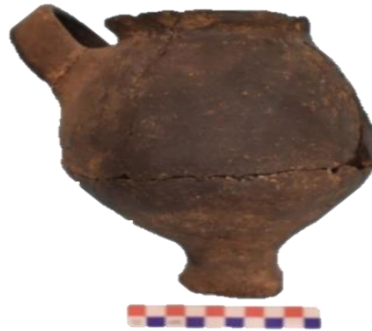
Fig. 14. Olla del estilo Asto de base pedestal del Intermedio Tardío a Horizonte Tardío.

cuello con círculos en horizontal que rodea al cuello, mayormente sus decoraciones son incisas o impresiones circulares, algunos caras abstractas, algunos en el cuerpo tipo incisiones y en su mayor parte presentan manchas negra de reducción y hollines, en miniaturas presentan cántaros de base redondeadas y en ollas de base pedestal en algunas.(Fig.14 y 15)