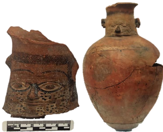
Fig. 07. Cara gollete y cántaro Calpish, fuente museo de sitio Wariwillka 2024.

Alfarería tosca del estilo Calpish C.-Se ubican ollas y cántaros. (Fig.07)