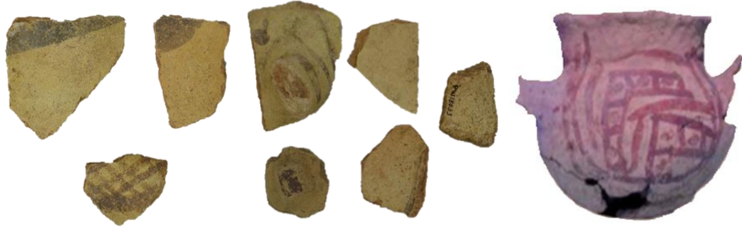
Fig. 09. Fragmentos de las vasijas del estilo Coras y olla Coras, fuente Ravines (2009) III. ESTILOS DE CERÁMICA DEL PERÚ ANTIGUO.