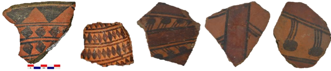
Fig.16. Imágenes de la cerámica estilo Inca registrados en las áreas del valle del Mantaro.

el caso de Arhuaturo-Inca en pequeñas o miniaturas botellas o formas de aríbalos. (Fig.16)