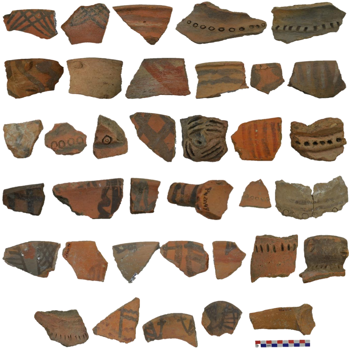
Fig. 11. Tiestos de diferentes diseños y decoraciones del estilo para identificar.

Cerámica estilo Arhuaturo – Mantaro Base Rojo. Estilo cerámico Arhuaturo correspondiente también al periodo Intermedio Tardío (1250-1460 d.C.), su característica para distinguir se predice dos tipos: uno oxidante y otro reductora, este último correspondiente exclusivamente a ollas u otra vasija de cocina y que cuya decoración es una ocasional aplicadas imágenes abstractas o en alguno tipo apéndices como botones.