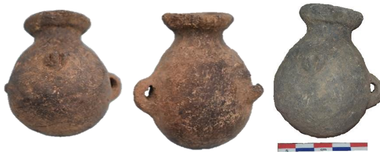
Fig. 15. Cántaros del estilo Asto en miniatura.