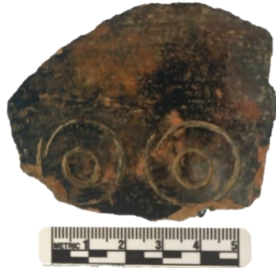
Fig. 02. Cerámica Pirwapuquio de una vasija

Este tipo de estilo también es vinculado por su semejanza con los estilos Chanapata del Cusco, Muyo Mogo de Andahuaylas, Wichqana de Ayacucho, Atalla de Huancavelica, tal como lo correlaciona Browman. (Fig.02).