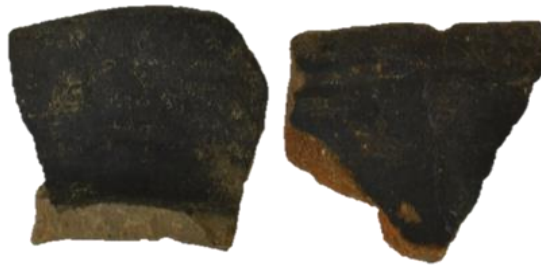
Fig.12. Bordes de ollas del estilo Arhuaturo.