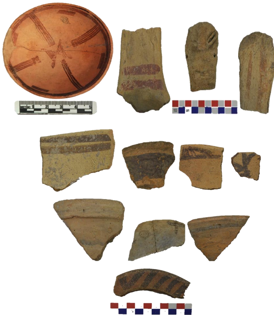
Fig. 05. Plato, figurina, fragmentos de cuenco y cántaro del estilo Huacrapuquio.

como “Chinos” (Villanes et. al. 2009). Las figurinas (conopas-illas) zoomorfas representan a camélidos en su estado de gestación, la cual haría referencia a la reproducción abundante de la ganadería de la época (Browman 1970). Las decoraciones pintadas incluyen motivos geométricos lineales de color púrpura azulada o marrón grisáceo sobre el fondo natural de las vasijas anaranjado claro, beige o crema. (Fig.05)