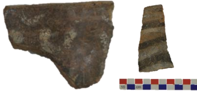
Fig. 06. Cerámica del estilo Calpish, fragmento de borde de un plato y mango del cucharón.

Calpish C. esta fase es más fina, en este estilo y similar a la cerámica Wari, que la mayoría de los warílogos confunden con la cerámica Ocros expresado por Menzel (1968). Esta de engobe naranja, sobre el van diseños de colores negro, plomo, rojo, marrón granate y guindo, en el diseño geométrico. Esta última fase incluye dos tipos de alfarería, uno tosco con formas de ollas y cántaros y el otro fina de multicolor de cuencos, escudillas, tazón y platos, etc.