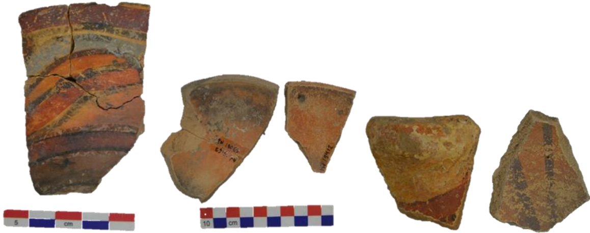
Fig.08. Escudilla, plato y cuencos del estilo Calpish C.

Cerámica estilo Coras. Identificado por Matos (1959) determinando cronológicamente al periodo Intermedio Tardío alcanzando su máxima expresión hasta Horizonte Tardío; sin embargo, Browman (1970) basado en sus estudios con carbono catorce C14 establece dentro del cuadro cronológico dentro del periodo Horizonte Medio y su difusión predominante en el periodo Intermedio Tardío, nosotros basándonos en su estudio sistemático de Browman respaldamos que abarca dentro del periodo Horizonte Medio (650-1000 d.C.) estilo de cerámica de manufactura tosca, bañadas con un grueso engobe de color blanco cremosa y de espesor gruesa. Su decoración es pintada constituida por diseños geométricos abigarrados que combinan líneas irregulares de colores rojo, sepia y negro. Presentan líneas no definidas u orientaciones irregulares, líneas onduladas, rombos dentro de paneles. Este estilo es fácil de identificar encontrándose disperso a lo largo y ancho de la cuenca del valle del Mantaro incluyéndose en las provincias de Acobamba, Huancavelica, Angaraes y expandiéndose por el sur de Huamanga y por norte hasta Jauja. En este estilo se encuentran ollas con apéndice, jarras, cántaros, platos, cuencos de espesor gruesa, cucharas y en su mayoría presentan con decoraciones rojas sepia y negras de líneas gruesas. ( Fig.09 )