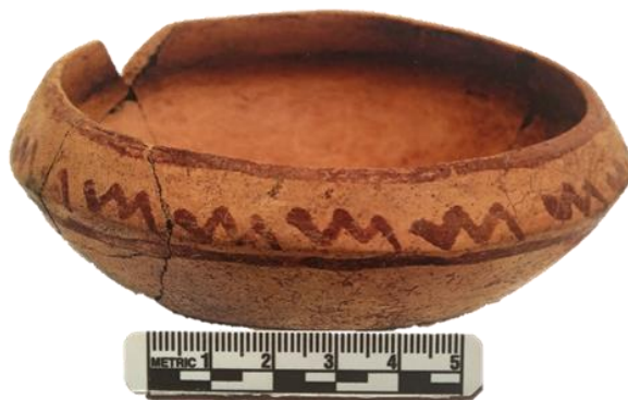
Fig. 03. Cerámica Cochachongo, fuente museo de sitio Wariwillka.

Cerámica estilo Cochachongos. Estilos propios de Huancayo, Junín y por ende en parte de Huancavelica que son correspondientes al Horizonte Temprano (650 a.C.-0 hasta 50 d.C.) Browman (1970) estilo propio que distingue de 5 alfareros locales y 2 externas relacionado con los estilos de Paracas y Chupas. Sus decoraciones son locales con diseños incisas estampados con caña y puntuaciones. Sin embargo, más característico es decoración pintada bícroma (rojo sobre blanco o negro sobre blanco), con incisiones y círculos estampados con caña, líneas onduladas delimitados horizontalmente. (Fig.03)