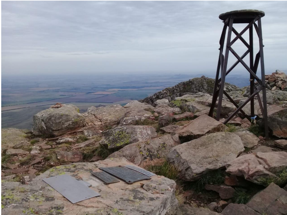
Figura 4 - Hito geodésico y placas en cumbre del Tres Picos