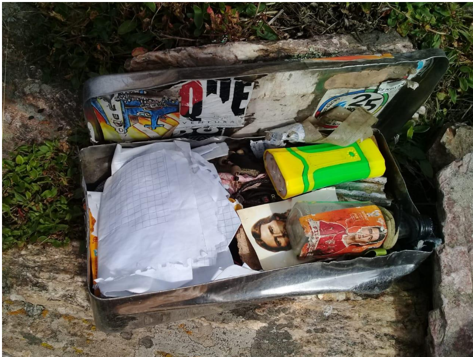
Figura 6 - Exvotos y recordatorios en caja para libro de cumbre