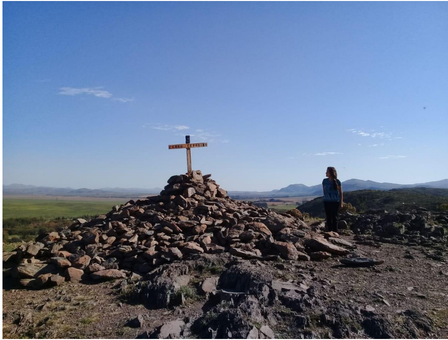
Figura 15 - Cruz y montículo de lajas en el Cerro del Amor o Ceferino