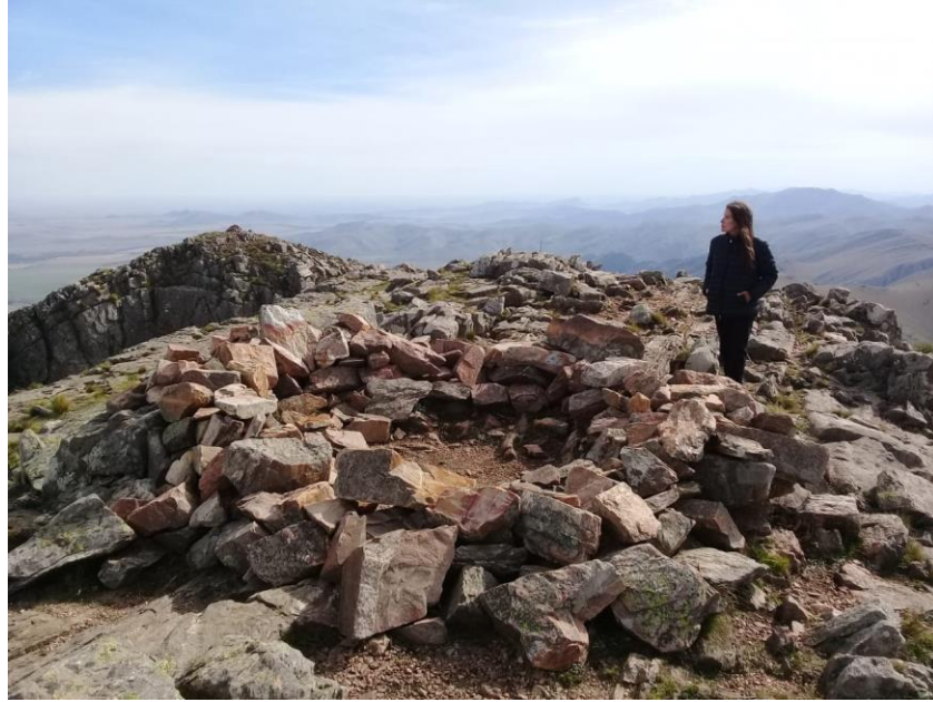
Figura 5 - La autora en la cima del Tres Picos