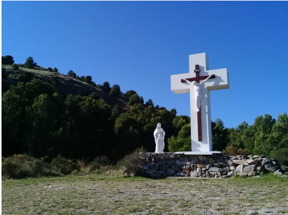
Figura 9 - Cruz en Calvario de Tornquist