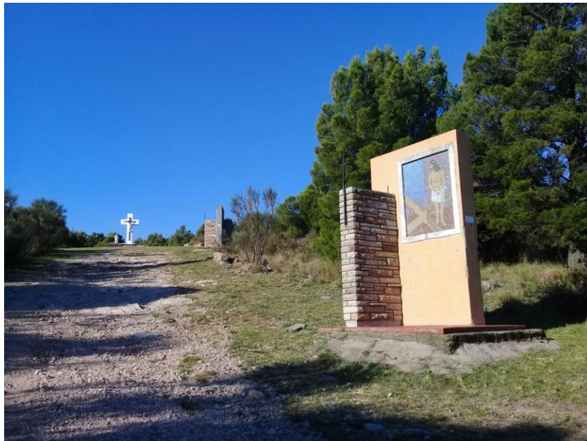
Figura 8 - Vía Crucis en Calvario de Tornquist