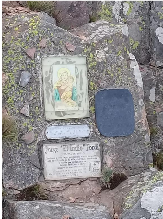
Figura 7 - Placas conmemorativas y religiosas en cima del Tres Picos