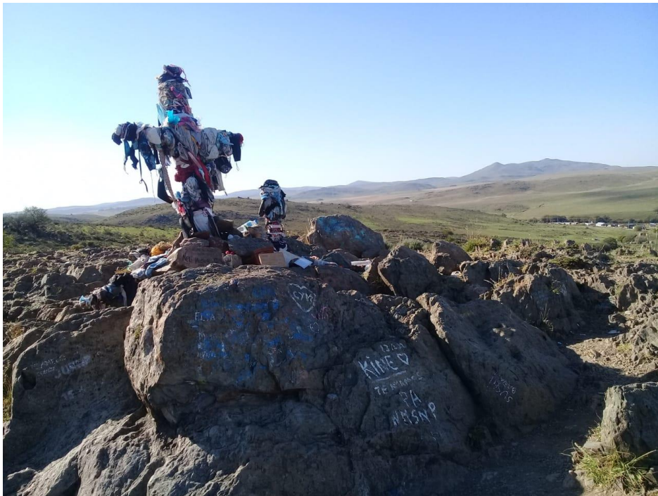
Figura 16 - Cruz con exvotos en el Cerro Ceferino