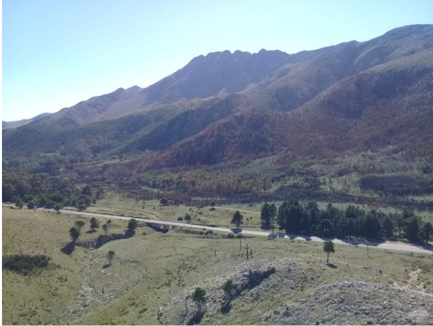
Figura 11 - Sierra de la Ventana vista desde el Mirador Cashuati