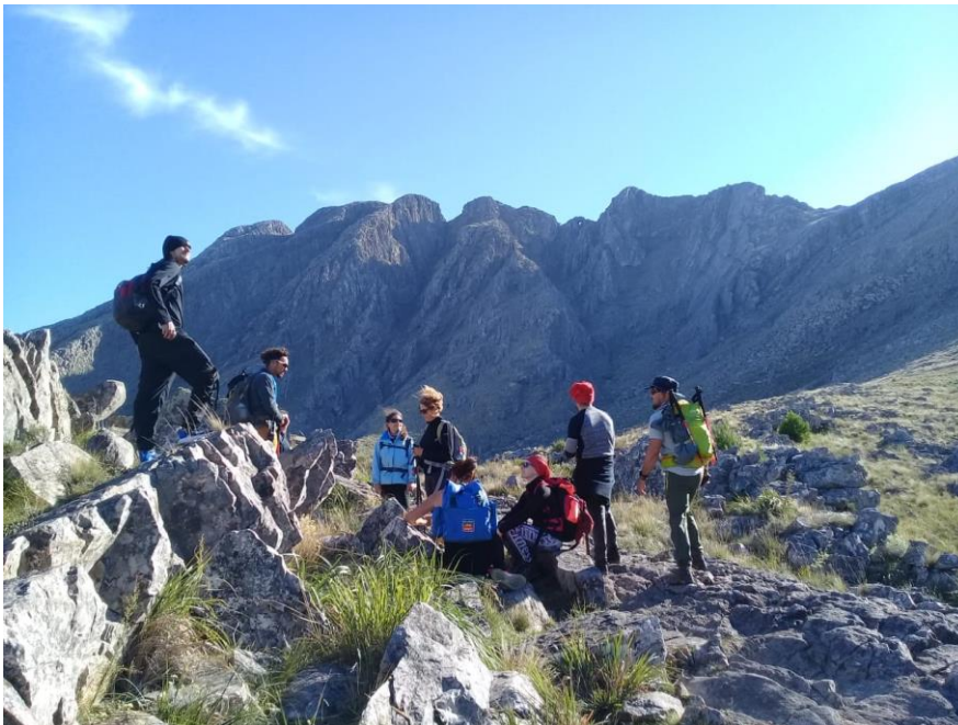
Figura 12 - Senderistas camino a la Ventana (1)