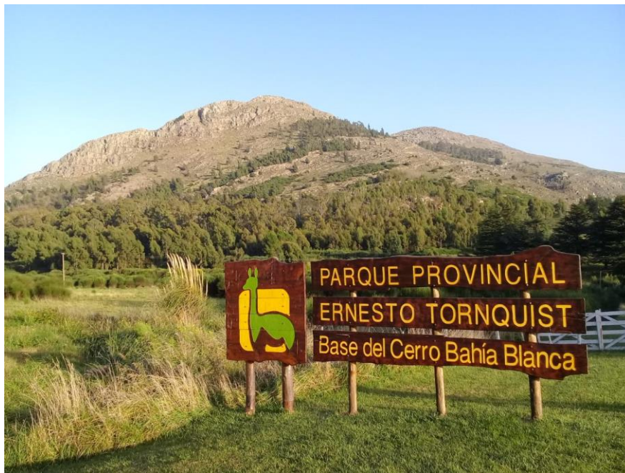
Figura 14 - Cerro Bahía Blanca en Sierra de la Ventana