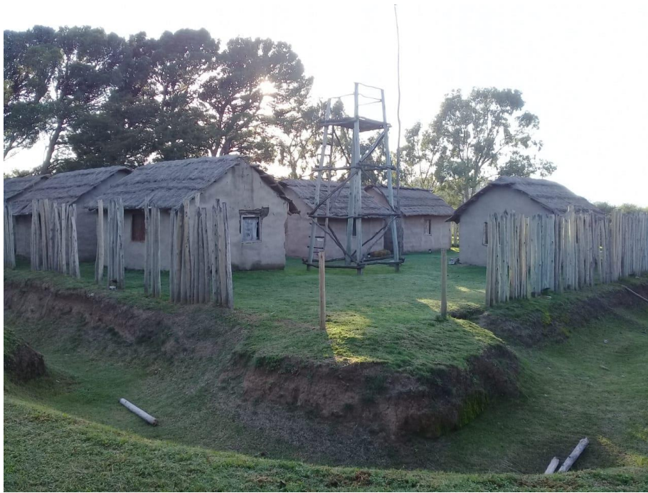
Figura 1 - Fortín histórico en la pampa bonaerense a los pies del sistema de Ventania