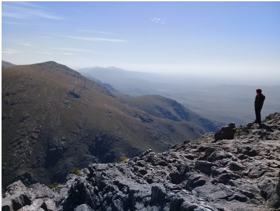
Figura 2 - Alturas del Sistema de Ventania