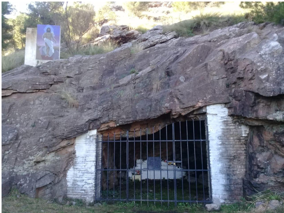
Figura 10 - Cristo yacente y triunfante en Calvario de Tornquist